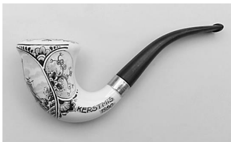
10. Kerstpijp 1990, model Calabash.

verhuisde Westraven van Groenekan naar het industrieterrein in het Utrechtse stadsdeel Overvecht. Later toen ik in 1992 deze Faïence- en Tegelfabriek Westraven bezocht konden hier (volgens de catalogus) wel 50 gegoten pijpen in verschillende modellen en kleur op bestelling geleverd worden. Het kleurenscale van de gebruikte glazuren was breed, nl. wit, zwart, rood blauw, grijs en delfts blauw. De Delfts blauwe kerstpijp van 1990 is zeker op deze Utrechtse locatie vervaardigd. (afb. 10) Speciaal voor rokers, die een ‘sterker kruid’ wilden roken dan tabak, werd een acht cm lang schuitvormig pijpje ontworpen. Deze crèmekleurige “Picolo” met fraaie zwart gezoomde grijze bies, werd mogelijk daarom niet in de catalogus opgenomen. Dit unieke pijpje is gedeeltelijk dubbelwandig en heeft een ongeglazuurd kuiltje als ketel. (afb. 11)