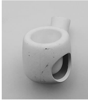
5. Biscuit met venster, "Hollow Bowl" principe.