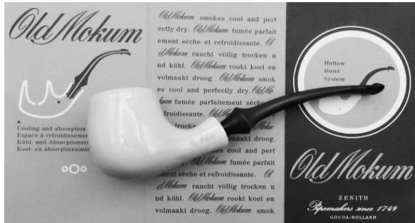
6. Black Magic pijpen met folder