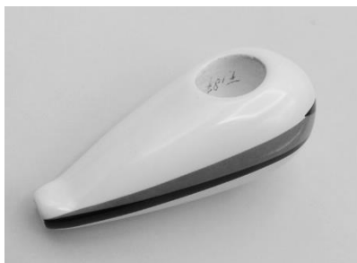
11. Exclusief pijpje Picolo, gemaakt bij Zenith Westraven.