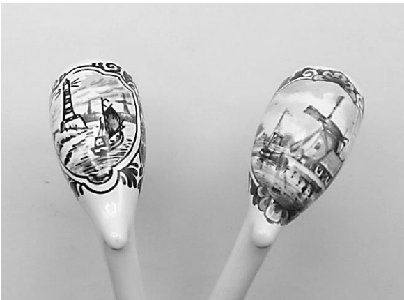
12. Geglazuurde Delfts blauwe lakpunten met vuurtoren en molen.

In 1994 staakte Westraven in Utrecht haar activiteiten en keerde de productie weer terug bij het moederbedrijf in Delft, waar nu nog de fraaie gegoten, geglazuurde delfts blauwe versie van de “lakpunt” wordt vervaardigd. De ongeglazuurde versie is nog populair bij pijpookwedstrijden en studentenverenigingen. De geglazuurde lakpunten met Delftsblauwe afbeeldingen op de pijpenkop zijn ware pronkstukken. Ze hebben, in plaats van de bekende blauwe plakker met de firmanaam, in Delfts blauw een bloemversiering en de naam ‘Zenith’ op de steel. Er was keuze uit verschillende afbeeldingen zoals landschappen met molen of met een vuurtoren. De terra-keurige mondstukken werden niet geglazuurd. In souvenirwinkels in toeristencentra zoals in Volendam (en natuurlijk bij Royal Delft zelf) zijn ze nog steeds verkrijgbaar. (afb. 12). De bovengenoemde gegoten keramische pijpen en de eens zo populaire doorroker worden nu niet meer vervaardigd en zijn alleen nog bij oude ‘door-rokers’ en pijpenverzamelaars te vinden.