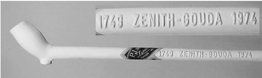
1. Jubileumpijp ‘1749 ZENITH-GOUDA 1974’.

In de dagbladen werd aan dit feestelijke jubileum ruim aandacht besteed, met koppen zoals: ‘In Gouda worden nog steeds pijpen met de hand gemaakt’ en ‘Oudste pijpenfabriek ter wereld heeft jongste pijpenmaker’. Voor mij was dit een unieke mogelijkheid om een traditionele pijpenmaker aan het werk te zien. Mijn verzoek om bezichtiging van de pijpenmakerij werd gehonoreerd met een uitnodiging voor een bezoek op 10 december 1974.