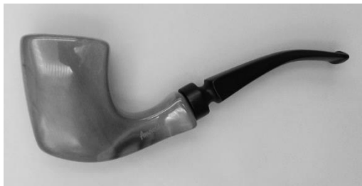
2. Keramische pijp, model Amsterdam.

gemaakt naar het model van de grammofoonhoren van het hondje dat naar His Master's Voice luistert. [...]” 2