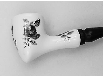
De 4. Model Manhattan (Lady's pipe).

Rond 1965 besloten de gebroeders Van der Want nieuwe modellen in het pijpenassortiment te introduceren in de kleuren, wit, zwart, rood, blauw, grijs